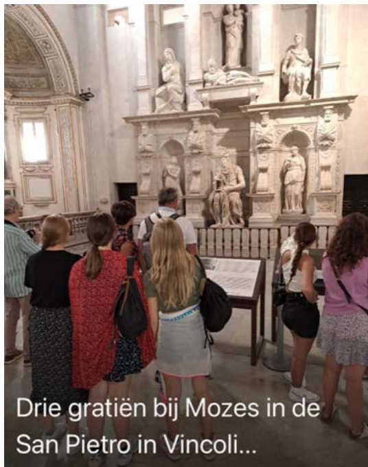
Drie gratiën bij Mozes in de San Pietro in Vincoli...