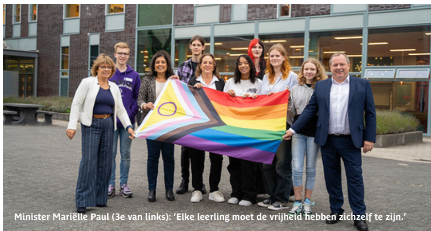
Minister Mariëlle Paul (3e van links): 'Elke leerling moet de vrijheid hebben zichzelf te zijn.'

Tijdens het bezoek is met de minister gepraat over de ontstaansgeschiedenis van de GSA. De leerlingen benadrukten hoe belangrijk het is dat ze op school zichzelf kunnen zijn en zich daarin door school gesteund voelen. Hoewel leerlingen af en toe nare opmerkingen krijgen of gepest worden, voelen ze zich serieus genomen door de schoolleiding en ervaren een veilige sfeer op school, wat de minister als uiterst belangrijk beschouwt.